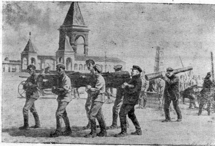
В. И. Ленин на Всероссийском субботнике в Кремле 1 мая 1920 года.

Ленинская теория социалистической индустриализации страны и знаменитый кооперативный план преобразования сельского хозяйства, получившие дальнейшее развитие в трудах И. В. Сталина и в партийных решениях, явились мощным оружием партии и всего советского народа в их борьбе за переустройство общества. Враги партии и народа—троцкисты, бухаринцы, буржуазные националисты—пытались свернуть партию и страну с ленинского пути на путь реставрации капитализма. Коммунистическая партия под руководством Центрального Комитета во главе с И. В. Сталиным, великим продолжате-