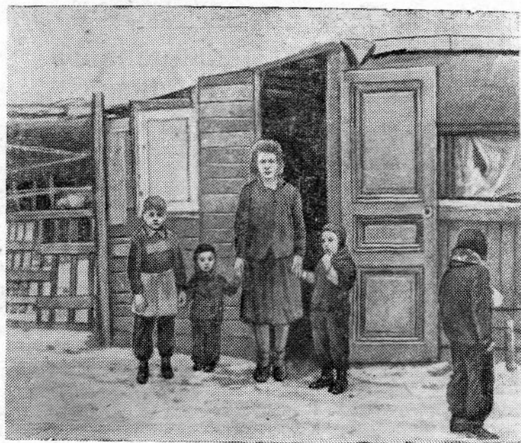
Жилищный вопрос продолжает оставаться во Франции исключительно острым. Тысячи бездомных французов не знают днем, где они проведут ночь. В этом году зима в Европе была очень суровой. Французские газеты сообщили, что в сильные морозы замерзали ночевавшие на улицах дети и взрослые. Журнал «Пари-матч» поместил несколько снимков, свидетельствующих об ужасных жилищных условиях, в которых живут семьи многих французов. На снимке: в этом наскоро сколоченном бараке живет большая семья.

ПАРИЖ. Общественность Франции решительно выступает за немедленное прекращение войны в Индо-Китае. Как сообщает газета «Юмани-те», за последние дни в департаменте Ло и Гаронна 11 генеральных советников, 45 мэров и 260 муниципальных советников потребовали немедленно заключить перемирие с правительством Хо Ши Мина. В этом же департаменте за переговоры с правительством Демократической Республики Вьетнам с целью заключения перемирия высказался почти весь состав муниципального совета города Ажен.