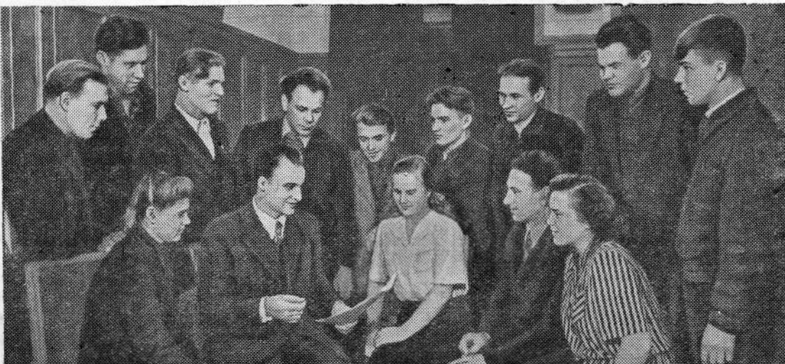
Группа рабочих и специалистов Московского автозавода имени Сталина изъявила желание поехать на освоение целинных и залежных земель, чтобы принять участие в использовании могучих резервов расширения сельскохозяйственного производства.

На снимке: группа рабочих и специалистов Московского автозавода имени Сталина, уезжающих в районы освоения целинных земель.