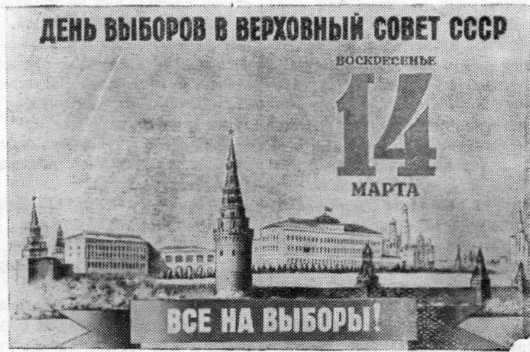
Плакат художника В. Викторова (Государственное издательство изобразительных искусств).

Товарищи избиратели! Дружно идите на избирательные участки, голосуйте за кандидатов блока коммунистов и беспартийных, лучших представителей народа!