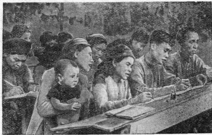
Правительство Демократической Республики Вьетнам и Вьетнамская трудовая партия уделяют большое внимание народному образованию. В республике создана широкая сеть школ и других учебных заведений. Открыто много курсов для взрослых. После создания республики 14 миллионов вьетнамцев научились писать и читать.

На снимке: занятия народных курсов по ликвидации неграмотности в одной из вьетнамских деревень.