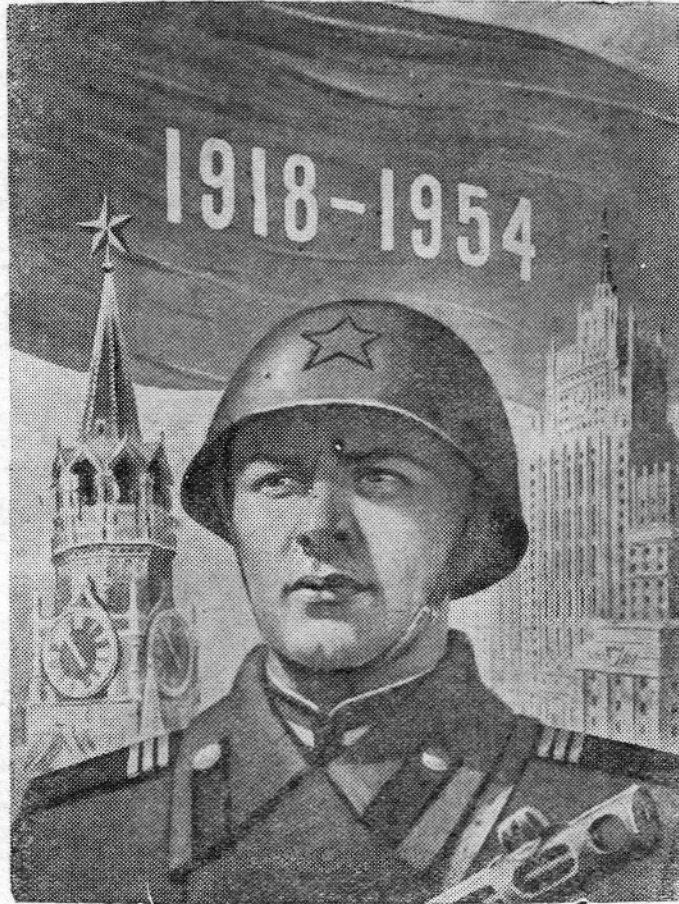
Рисунок Н. Павлова.

Да здравствуют Вооруженные Силы Советского Союза, стоящие на страже мирного труда советских людей!