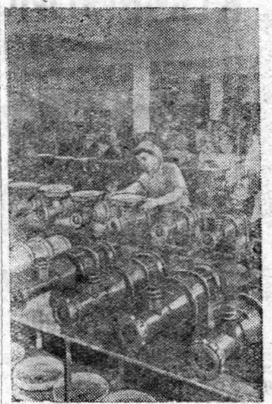
ХАРЬКОВ. Машиностроительный завод «Механолит» выпускает оборудование для торговых предприятий и для сети общественного питания. На снимке: в сборочном цехе пищевых машин.

ВСЕСОЮЗНЫЙ ЦЕНТРАЛЬНЫЙ СОВЕТ ПРОФЕССИОНАЛЬНЫХ СОЮЗОВ