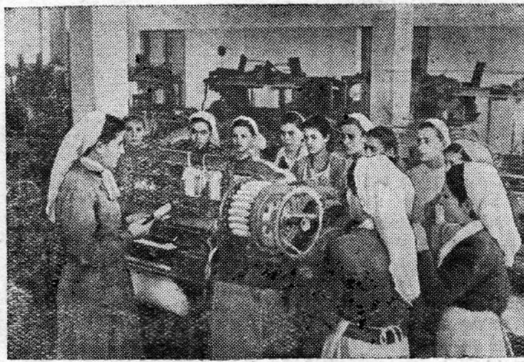
На многих предприятиях Народной Республики Албании открыты учебные заведения, которые готовят для развивающейся промышленности страны квалифицированных рабочих различных специальностей. На снимке: учащиеся школы при текстильном комбинате имени Сталина в Тиране на практических занятиях в цехе.